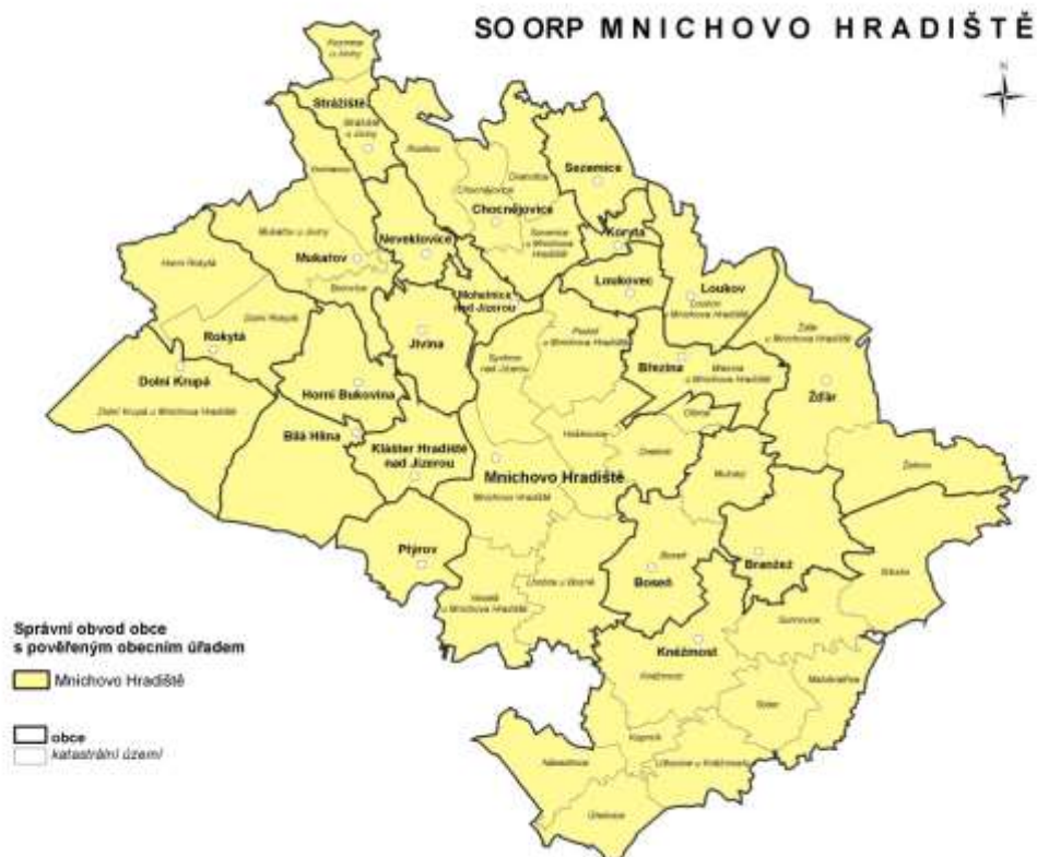
Mapa č. 1: Administrativní členění správního obvodu

Správní obvod obce s rozšířenou působností (dále jen SO ORP) Mnichovo Hradiště se rozkládá na severu Středočeského kraje na území okresu Mladá Boleslav. Sousedí ve Středočeském kraji s SO ORP Mladá Boleslav, v Libereckém kraji s SO ORP Česká Lípa, SO ORP Liberec a SO ORP Turnov a v Královéhradeckém kraji s SO ORP Jičín. SO ORP Mnichovo Hradiště tvoří 22 obcí. Přírodním centrem je Mnichovo Hradiště, které zároveň vykonává i agendu obce s pověřeným obecním úřadem. Správní obvod obce s pověřeným obecním úřadem se v tomto případě přesně kryje s SO ORP. Ostatní jsou obce 1. typu. Statut města má pouze Mnichovo Hradiště. SO ORP má rozlohu 212,5 km 2 a zaujímá 1,9 % území kraje.