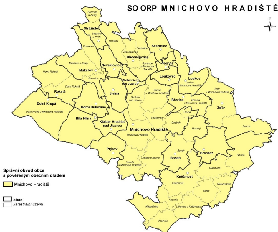
Mapa č. 1: Administrativní členění správního obvodu

Správní obvod obce s rozšířenou působností (dále jen SO ORP) Mnichovo Hradiště se rozkládá na severu Středočeského kraje na území okresu Mladá Boleslav. Sousedí ve Středočeském kraji s SO ORP Mladá Boleslav, v Libereckém kraji s SO ORP Česká Lípa, SO ORP Liberec a SO ORP Turnov a v Královéhradeckém kraji s SO ORP Jičín. SO ORP Mnichovo Hradiště tvoří 22 obcí. Přírozeným centrem je Mnichovo Hradiště, které zároveň vykonává i agendu obce s pověřeným obecním úřadem. Správní obvod obce s pověřeným obecním úřadem se v tomto případě přesně kryje s SO ORP. Ostatní jsou obce 1. typu. Statut města má pouze Mnichovo Hradiště. SO ORP má rozlohu 212,5 km 2 a zaujímá 1,9 % území kraje.